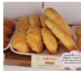
人気No.1 レモンパン 安くて、美味しくて、ボ リュームたっぷりです。