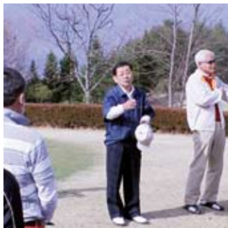
大木大会会長のあいさつ

組合創立40周年記念コンペが、平成25年3月23日（土）に、甲斐市北部にある甲斐ヒルズカントリー倶楽部（旧甲斐芙蓉カントリー倶楽部）で開かれた。このコンペ開催のきっかけは、昨年11月9日に甲府富士屋ホテルで開かれた組合創立40周年記念祝賀会