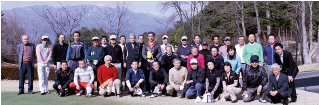
スタート前、コンペ参加者全員で記念撮影

組合創立40周年記念コンペが、平成25年3月23日（土）に、甲斐市北部にある甲斐ヒルズカントリー倶楽部（旧甲斐芙蓉カントリー倶楽部）で開かれた。このコンペ開催のきっかけは、昨年11月9日に甲府富士屋ホテルで開かれた組合創立40周年記念祝賀会